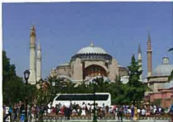
写真4, 5) アヤソフィア：東ローマ帝国の時はキリスト教の教会。オスマントルコに征服された後、モスクに作り替えられました。今は博物館。