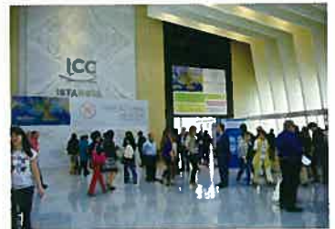
写真1) 学会場の入り口。

学会は発表のストレスもさることながら、観光に出かけることが大きな楽しみです。1453年に東ローマ帝国がオスマントルコに滅ぼされ、ビザンチン文化はイスラムの世界へ一変した。アヤソフィア(博物館)はキリスト教の教会(東ローマ帝国の代表的な遺構、ビザンチン建築の最高傑作)が、モスク(イスラム教の教会、オスマン帝国で最も格式が高い)に改修されたもの(写真4)。十字架などは取り払われたが、キリスト教の面影はいたるところに見られる(写真5)。