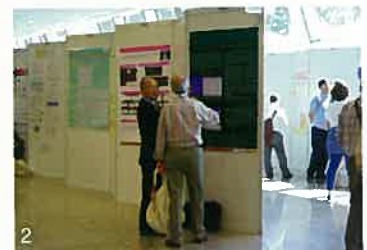
写真2) 発表風景：参加者は少なめですが、質問に答えています。