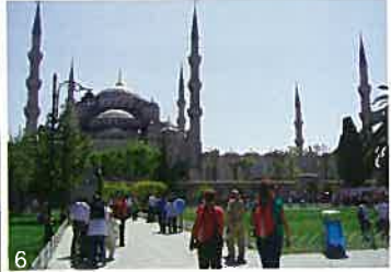
写真6) ブルーモスク、6本のミナレットが特徴。