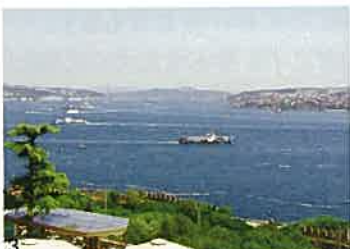
写真3) ボスポラス海峡：ヨーロッパとアジアの境界。手前がヨーロッパ。奥に見える橋は日本の建設会社が作りました。