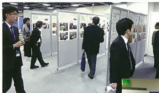
患者様の自宅透析部屋の写真展示

会の開催にあたり1年以上前から準備を重ねてきましたが、この会で私たちが最も伝えたかったことは当院の在宅血液透析の基本の「十分に透析をすることで安全に治療ができて元気になれる」ということと当院の患者さんたちが自分の意思で自分の生活スタイルに合わせて透析を行いとても元気であるということでした。そこで、当院の患者さんの透析のお部屋を写真で展示したところ、これが大好評! 写真を写真に撮ろうとする人が続出でした。ごく普通の住宅で自然に生活の空間の中に透析が組み込まれていることが伝わったと思います。また、各機械メーカーさんには自社の機械を使って在宅のモデルルームを作ってみて下さいというお題を出し、工夫して展示していただきました。全国から体験談を募集したところ、思いのほかたくさんお寄せいただきプログラムとは別にまとめた体験談集も大人気でした。