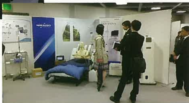
メーカーによる展示

会の後、「勉強になりました」「手作りの温かい会でしたね」「自分の施設でも是非これから在宅血液透析をはじめたい」「体験談集を送ってください」「自己穿刺のDVDをいただけませんか」「ランチョンセミナーのお弁当がおいしかったです。」「就職を希望します」などなど様々なお問い合わせや反響がありました。それもこれも患者の皆様が惜しみなく協力して下さった結果であると思います。本当にありがとうございました。スタッフ一同、大変でしたがとても良い経験をさせていただきました。