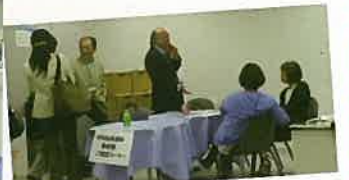
在宅血液透析患者様相談コーナー

普段、クリニックでも在宅をされている皆さんと接することも少なく、なかなか経験者を生の声で聴くこともなかったので今回、いろんな意味で勉強になりましたし、吸収できることもたくさんありました。一番感じたのはそれぞれが独自にアレンジした透析環境を作り、それをサポートする医療スタッフ、在宅透析は患者も含めたチーム医療で成り立つ医療であるということです。施設透析の私も見習う点がたくさんありましたし、今回は私自身とても有意義な時間を過ごせたと思います。